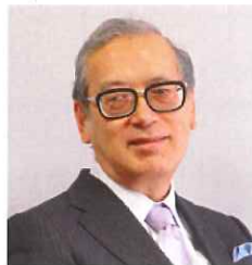
田島眞 (一般社団法人 日本食育学会会長)